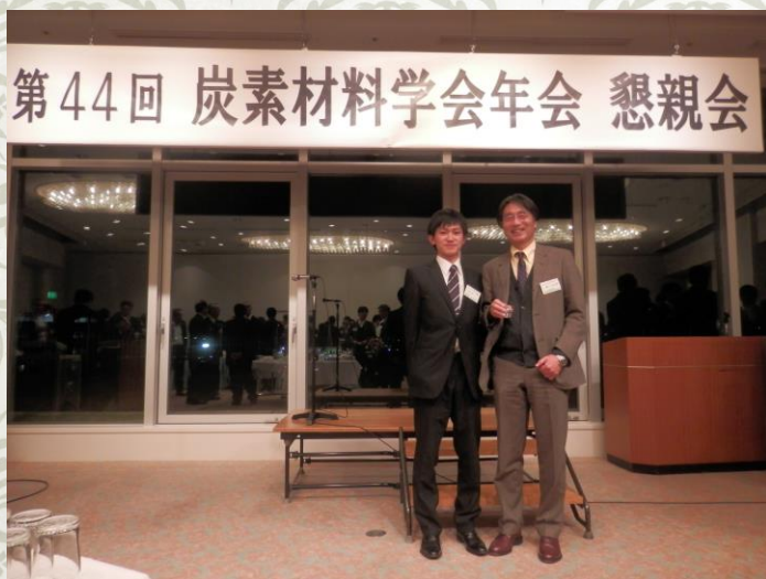
授賞式後、豊田教授と